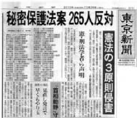
東京新聞 10月29日付 朝刊